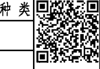
图 幅: 0.250 A1